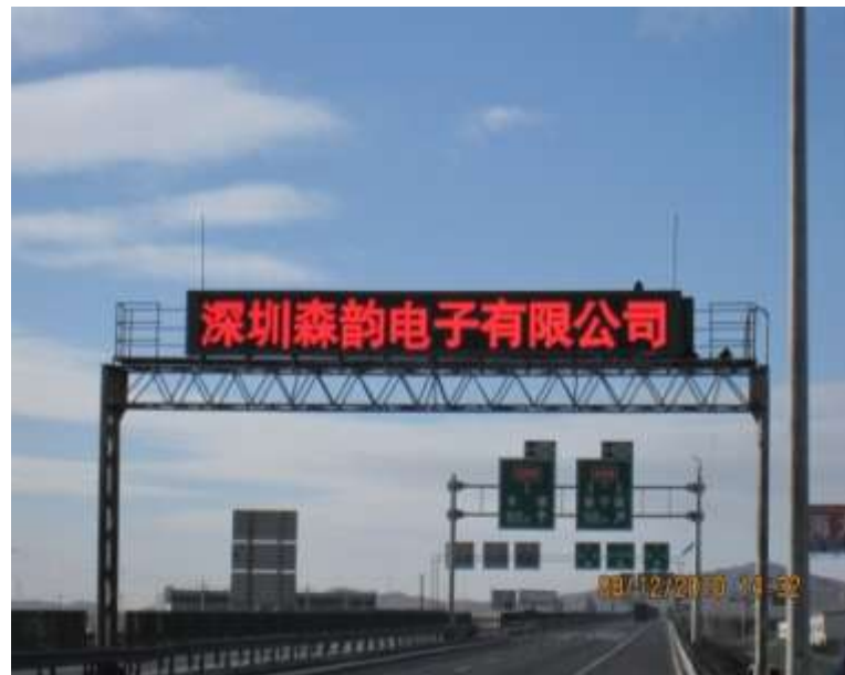
2010年内蒙古交通诱导屏 案例