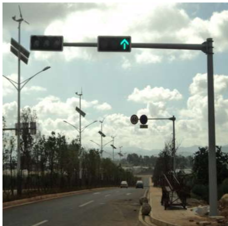
2011年云南昆明400型箭头灯案例