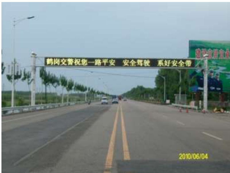
2010年黑龙江鹤岗交通 诱导屏案例