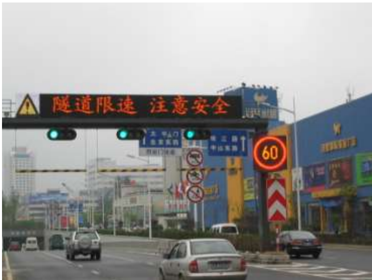
2011年南京交通诱导屏， 限速标志与满盘灯案例