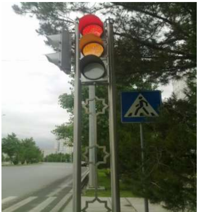
2009年土库曼300型铝壳满屏灯案例