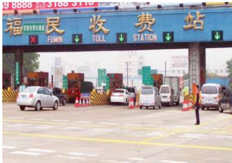
2006年深圳福民收费站雨 棚信号灯应用案例