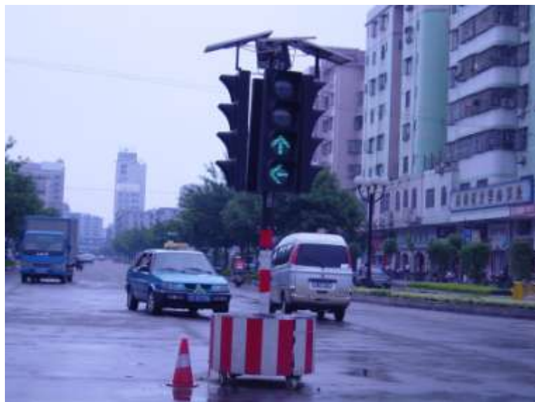
2008年广东佛山移动式 太阳能交通灯案例