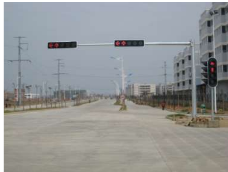
2010年广西南宁机动车 组合灯与非机动车组合 灯案例